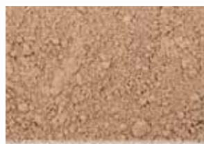
CR-300 – Autumn Brown