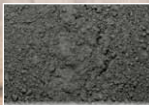
CR-947 – Dark Gray