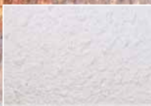
CR-NAT – Natural