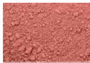
CR-835 – Red Brick