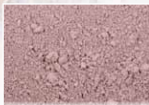
CR-880 – Lavender Blush