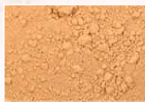
CR-730 – Misty Peach