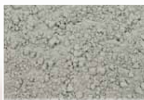
CR-592 – Slate Green