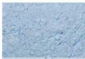
CR-670 – Powder Blue