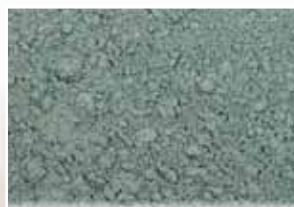
CR-599 – Seafoam Green