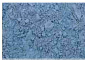
CR-675 – Star Blue