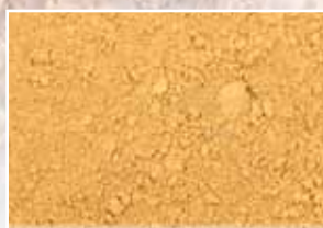
CR-700 – Light Goldenrod