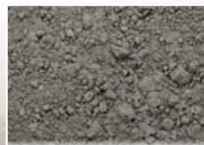
CR-927 – Gray