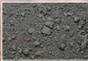
CR-935 – Charcoal