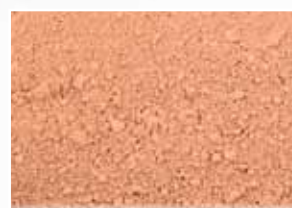
CR-718 – Terra Cotta