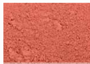
CR-827 – Sienna