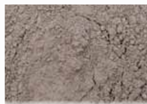
CR-389 – Dark Brown