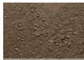
CR-395 – Smokey Brown