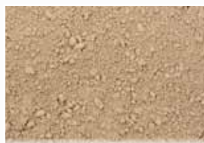
CR-219 – Sandy Buff