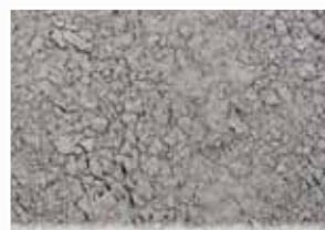
CR-923 – Silver