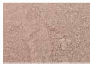
CR-228 – Copper Brown