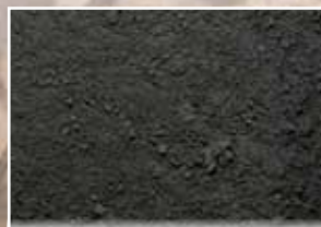
CR-960 – Rich Black